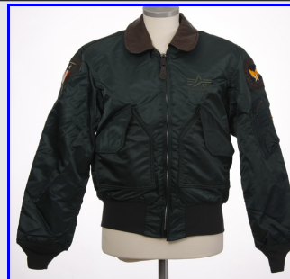
Bomber CWU-45 Flight Series Vintage Made in USA